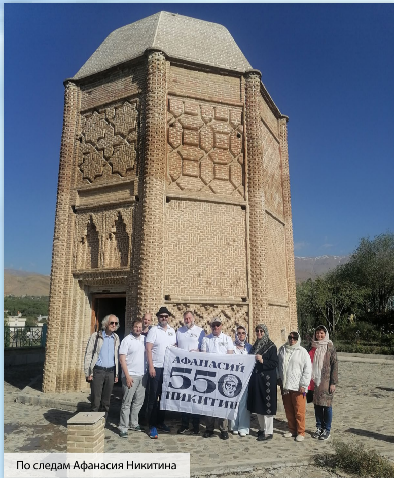
По следам Афанасия Никитина

Главное же, что нас всех интриговало, – это автобусное путешествие по следам Афанасия Никитина. Предстояло побывать в местах, которые упомянуты в его путевых записях, а значит