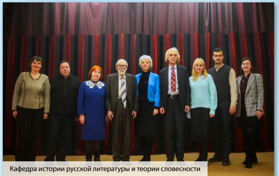
Кафедра истории русской литературы и теории словесности