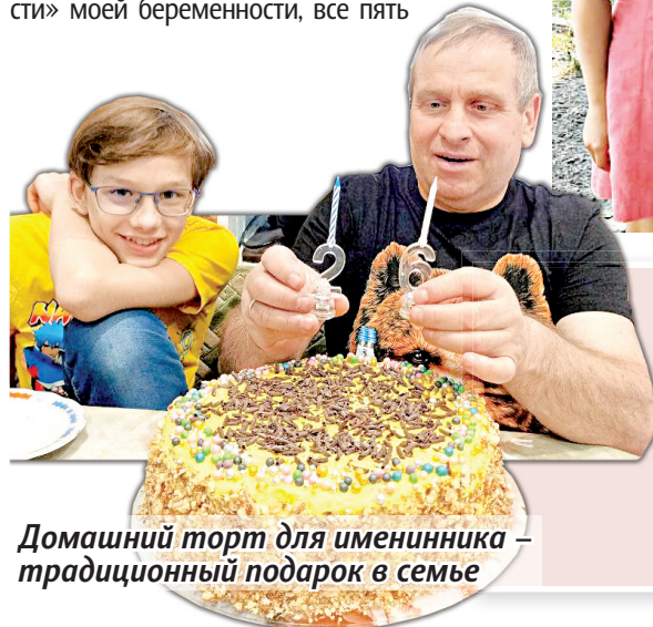
Домашний торт для именинника – традиционный подарок в семье

«Вы не поверите, но муж все «прелести» моей беременности, все пять