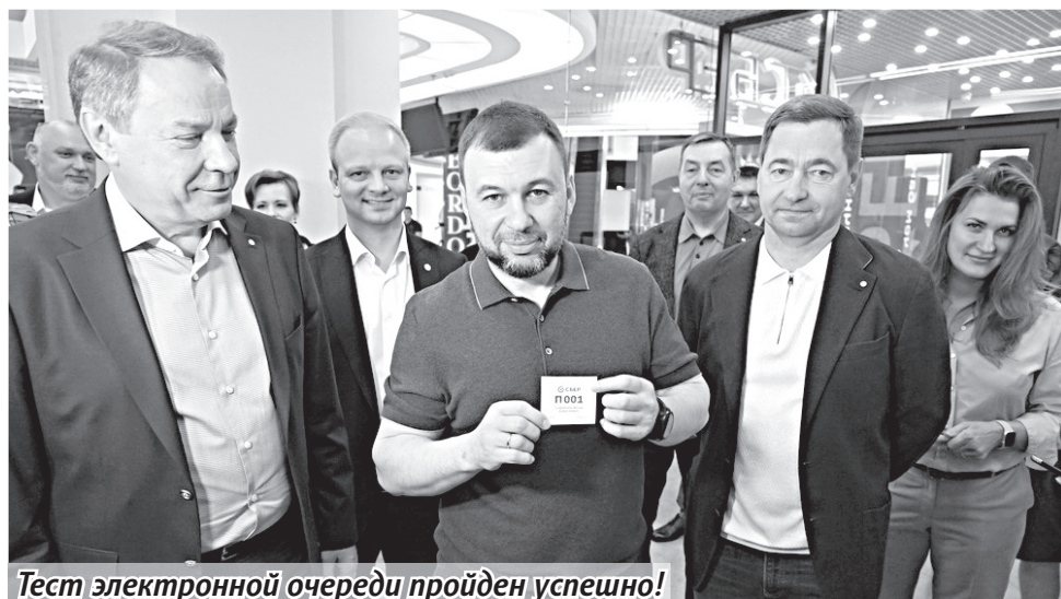
Тест электронной очереди пройден успешно!

Затем Главе ДНР показали работу нового отделения Сбербанка и рассказали, какие именно услуги будут оказываться: это возможность получения кредита, оформление ипотеки, работа с юридическими и физическими лицами,