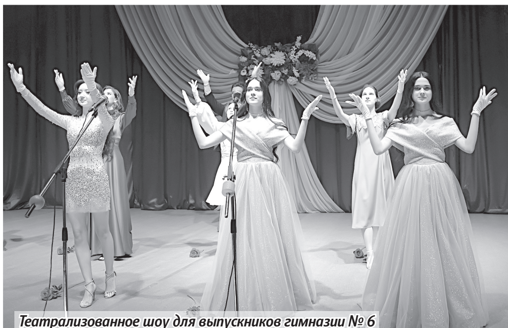
Театрализованное шоу для выпускников гимназии № 6

– Для нас сегодня очень знаменательный день. Волнительный, волшебный. Эмоции переполняют, все сегодня ка-