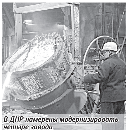
В ДНР намерены модернизировать четыре завода

Обсуждая инвестпроекты по модернизации промышленных предприятий, Денис Пушилин обозна-