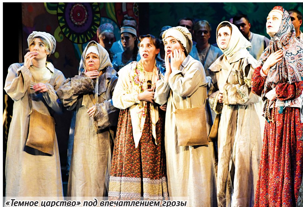
«Темное царство» под впечатлением грозы

В общем, статус «Всё сложно». И в этом как раз непреходящая современность драмы. Здесь не отцы и дети, не герой и толпа, не мораль и грех – здесь все сразу. Тотальная неспособность людского племени жить в гармонии.