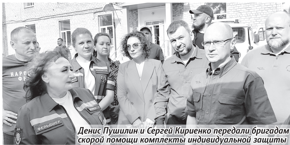
Денис Пушилин и Сергей Кириенко передали бригадам скорой помощи комплекты индивидуальной защиты