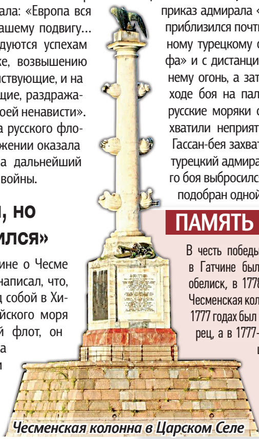
Чесменская колонна в Царском Селе

В честь победы при Чесме в 1775 году в Гатчине был установлен Чесменский обелиск, в 1778 году в Царском Селе – Чесменская колонна, в Петербурге в 1774-1777 годах был построен Чесменский дворец, а в 1777-1778 годах – Чесменская церковь. Почётное название «Чесма» впоследствии носил целый ряд кораблей Русского императорского флота.