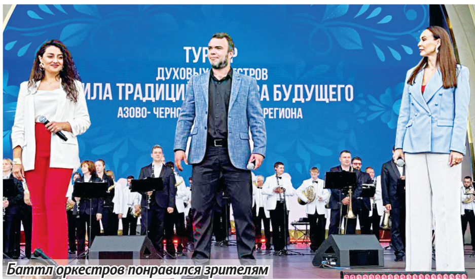
Баттл оркестров понравился зрителям

23 июня концертный оркестр духовых инструментов Донецкой государственной академической филармонии выступил в столице России. Но в этот раз духовой оркестр филармонии не просто порадовал публику концертом, а принял участие в творческом турнире. Мероприятие проходило в рамках Международной выставки-форума «Россия».