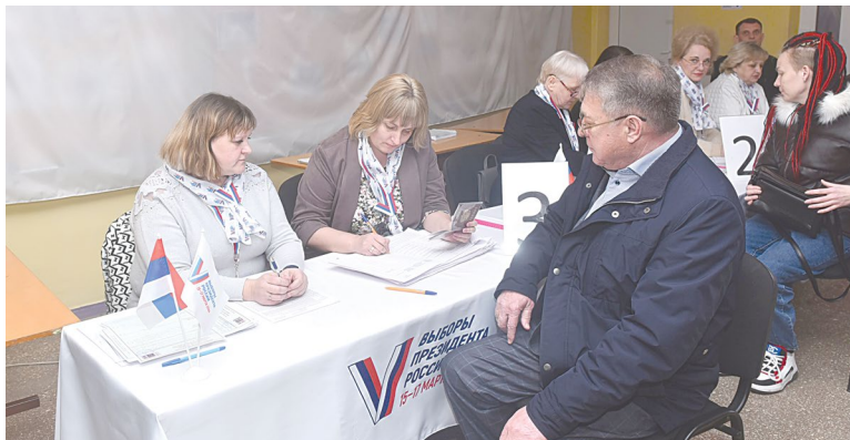
Работа участковой избирательной комиссии в Кировском районе Донецка

Тем временем в Куйбышевском районе наша газета познакомилась с жителями Красного