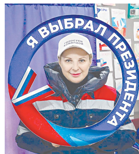
Энергетики ДНР на голосовании

Сергей КОЛОС