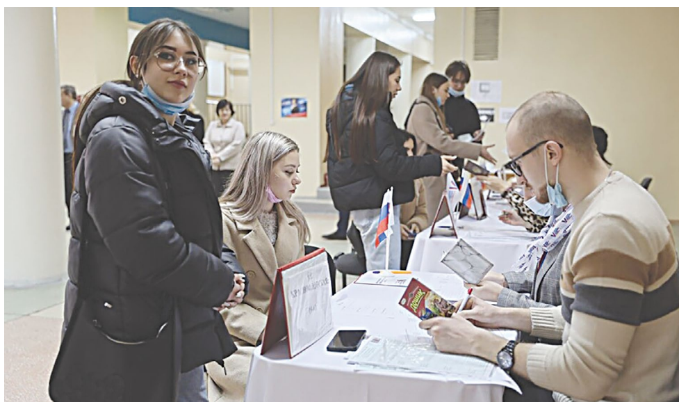
Молодежный участок Донецкого национального медицинского университета

«Очень приятно, что иностранные наблюдатели, которые фиксируют все действия на избирательных участках, высоко оценивают легитимность наших выборов, то, как они проходят, не отмечают нарушений. Отказ некоторых стран прислать наблюдателей — это их большая ошибка.