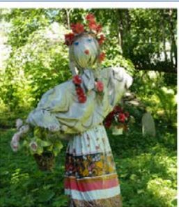
Куклы на даче и курень в х. Гороховском