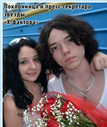
Поклонница и пресс-секретарь «Х-фактора»