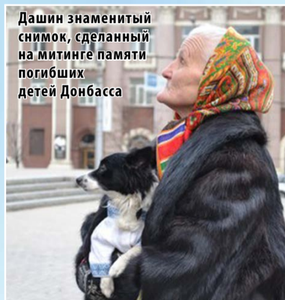
Дашин знаменитый снимок, сделанный на митинге памяти погибших детей Донбасса