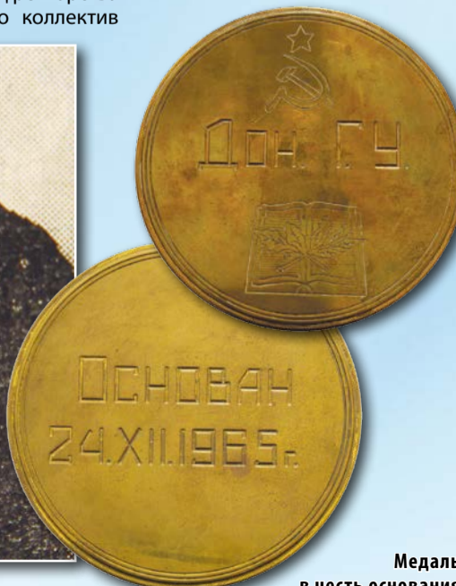
Медаль в честь основания Донецкого госуниверситета