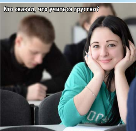
Кто сказал, что учиться грустно?