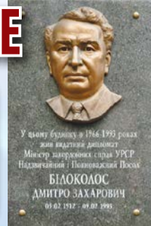
Мемориальная доска на доме по ул. Институтской в Киеве