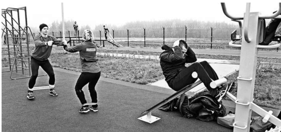
У пожарной части есть свой спорткомплекс

проходимости отечественного производства, пожарный пеноподъемник. Ежедневно на боевое дежурство выступают 10 человек личного состава – это три боевых расчета на двух автоцистернах и одном пожарном пеноподъемнике.