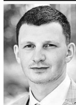
Юрий Бакулин, фотограф:

— На мой взгляд, система школьного образования сейчас находится на среднем уровне. Думаю, что неплохо было бы ввести новые предметы, но факультативно. Главное — нужно уделять больше внимания профориентации школьников.